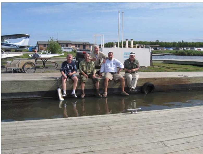
HOLDET ER KLAR TIL AFGANG

Vi vælger at indtage aftensmaden på Outback Steakhouse. De serverer blandt andet et kæmpeløg der bliver friturestegt og krydret. Meget speciel ret som på det varmeste kan anbefales.