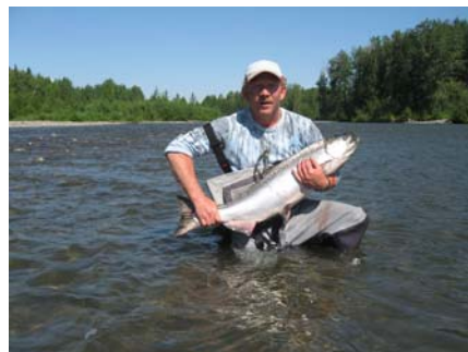
SNEPPE MED SIN FØRSTE KONGELAKS.

Efter maden begyndte Erik at lande fisk og var vi ikke desperate tidligere blev vi det nu. Undertegnede kunne ganske enkelt ikke leve med at være den eneste uden fisk på land!. Alt blev prøvet. Kort forfang, langtfang. Ny flue. Nye indtagnings teknikker og lige lidt hjælp det. Vi måtte lide den tort at gå i seng uden fisk på tasken. Ohh ak og ve en jammer. Hr.