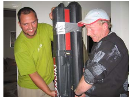
PAW OG KIM PAKKER STÆNGER

fylt med fiskesnak og en vært der forsøger at få pakket kuffert med tøj, grej og alle de små ting jeg absolut ikke kan undvære. Hvorfor er det lige jeg altid render rundt i sidste øjeblik og pakker. Og hvorfor er det lige jeg altid får taget alt alt for meget med. NU må jeg altså se at få lavet den pakliste så jeg ikke slæber mig en pukkel til. Det lykkes at få fyldt en kæmpe rejsetaske og lidt over midnat kan alle gå til ro, med laksedrømme og fight af fisk for det indre øje.