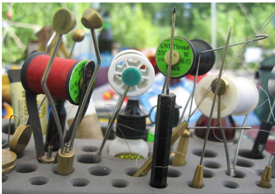
FLUEBINDINGSHYGGE I VILDMARKEN

Vejret kunne vi som nævnt dog ikke klage over og aftenkaffen/wiskyen blev nydt foran det buldrende bål om aftenen. Trods manglende fisk var det nu ganske rart og dejligt at være tilbage. Tilbage i mit fiskehjem. Forunderligt at føle sig hjemme her i ødemarken blandt ørne, elge, sønderjyder og vilde bjørne.